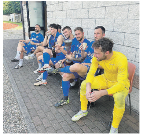
Giocatori e dirigenti del Nibbiano festeggiano dopo il triplice fischio la conquista della Supercoppa regionale di Eccellenza, ottenuta battendo il Mezzolara a San Felice sul Panaro (Modena)