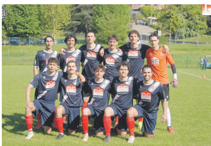
Una formazione del Siepelunga Bellaria, avversario del Bobbio Perino